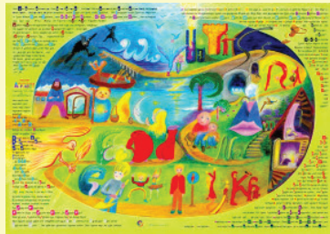
Bild und Schrift

Das Poster (auch als Spielfeld verwendet) ist für jede Altersstufe die Grundlage für den Aufbau eines konzentriert arbeitenden Gehirns. Aus der Vogelperspektive zeigt es das Land, in dem die Alphabet-Erzählung spielt. Die runde Form vermittelt Geborgenheit und Sicherheit. Es enthält auch die Schlüsselsätze der Buchstaben als Kurzform der Erzählung. ISBN 978-3-948214-02