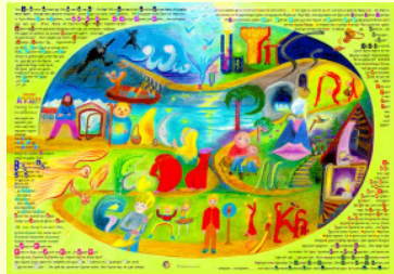
Immagine e scrittura

Il Poster (usato anche come tabellone di gioco) è la base di ogni età per lo sviluppo di funzioni cerebrali focalizzate. Da una prospettiva a volo d'uccello, mostra l'intera storia dell'alfabeto. Con la sua forma arrotondata questa visione globale è rassicurante e avvolgente. Contiene anche le frasi chiave delle lettere. Si tratta della versione breve della storia.